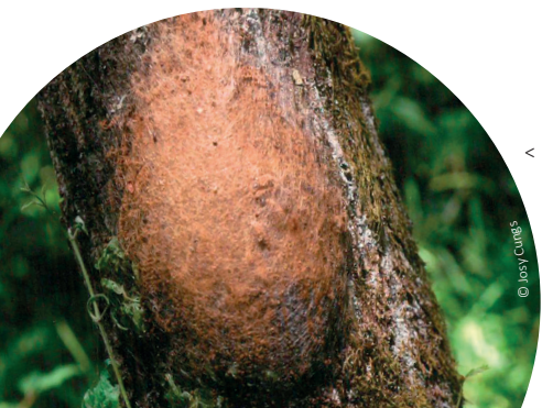
< nid de la processionnaire du chêne

La chenille se développe en automne et passe tout l'hiver dans l'œuf. En début de la période de végétation (fin avril, début mai), les chenilles éclosent. Elles passent alors par 6 stades de développement pour arriver à la nymphose. Dès le début, les chenilles sont très poilues, elles ont d'abord une coloration brun-jaune qui deviendra par la suite noir-bleuâtre. Sur 8 segments de l'abdomen, la chenille porte des zones constituées de poils soyeux de couleur brun-rouge, appelées miroirs. Sur ces derniers se trouvent à partir du 3 ème stade larvaire, des poils pourvus d'aiguillons urticants qui contiennent une toxine appelée thaumétopoéine. Le nombre, ainsi que la longueur de ses poils irritants augmentent avec chaque mue de la chenille. A la fin du 6 ème stade larvaire, la chenille peut atteindre une taille de 4 cm.