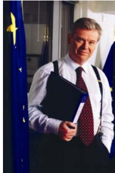
David Byrne Commissaire Européen pour la Santé et la Protection du Consommateur